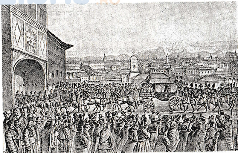
Cortegiul domnesc trece pe sub turnul mitropoliei.

două țări române. După o încercare neizbutită de a constitui, în Moldova, o Adunare ad-hoc dominată de adversari ai unirii, Poarta Otomană se vede nevoită să organizeze o nouă consultare populară, încheiată cu o victorie concludentă a elementelor uni-oniste. În Rezoluția adoptată de Adunarea ad-hoc din Moldova (octombrie 1857) se cerea „Unirea Principatelor într-un singur stat sub numele de România”; „Printz străin cu moștenirea tronului, ales dintr-o dinastie domnitoare a Europei, ai cărui moștenitori să fie crescuți în religia țării”. O rezoluție cu un conținut identic este adoptată și de Adunarea ad-hoc din Țara Românească.