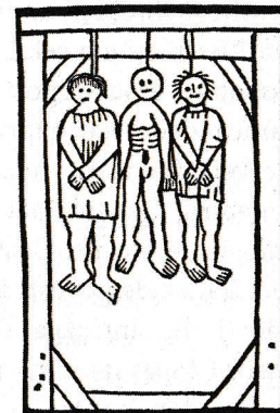
„Spânzurații“ („ Les pendus “), gravură din Oeuvres de François Villon , imprimată de Pierre Levet, 1489

Surghiunirea lui Villon din Paris pe 3 ianuarie este ultima veste pe care o avem despre el. Nu știm nici unde, nici când a murit.