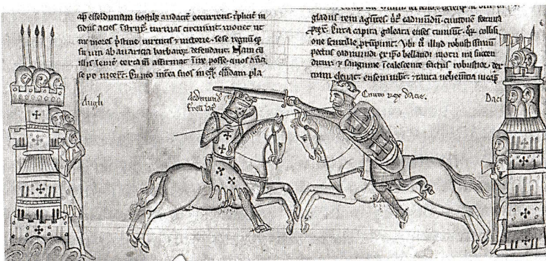
Manuscris medieval cu anluminuri înfățișându-i pe regii Edmund al II-lea al Angliei (stânga) și Canute, din Chronica Majora scrisă și ilustrată de Matthew Paris

Curtenii care-l însoțeau au așteptat ca marea să se supună, dar aceasta a continuat cu încăpățănare să-și rostogolească valurile. Când apa i-a udat încălțările, Canute s-a adresat curtenilor: