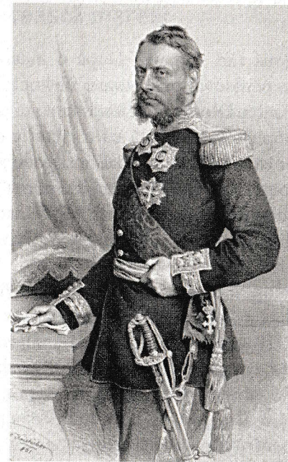
Alexandru Ioan Cuza, litografie de Josef Kriehuber, 1861

1859 În a doua jumătate a secolului al XIX-lea, accentuata decadere a Imperiului Otoman, concomitent cu creșterea apetitului Imperiului Rus de a anexa noi teritorii în drumul său spre Constantinopol, plănuıt de împăratul Petru cel Mare, a deschis și „problema românească”. În vara anului 1853, trupele Rusiei trec Prutul și ocupă principatele române, declarând război Imperiului Otoman. Este începutul conflictului armat cunoscut în istorie ca Războiul Crimeii (1853–1856). În primăvara anului următor are loc, la Viena, conferința internațională ce avea înscrisă pe ordinea de zi viitorul regim politic al Moldovei și al Țării Românești. În timpul lucrărilor, contele Walewski, reprezentantul Franței, se pronunță pentru unirea țărilor române sub un prinț autohton sau străin ereditar. Congresul de pace de la Paris (13/25 februarie–18/30 martie 1856), care punea capăt Războiului Crimeii, reia „chestiunea românească” și propune un set de măsuri pentru rezolvarea ei. Se prevedea convocarea, în Moldova și în Țara Românească, a unor Adunări (Divanuri) ad-hoc pentru a exprima voința poporului, prin aleșii săi din aceste organisme politice, în problema organizării viitoare a celor